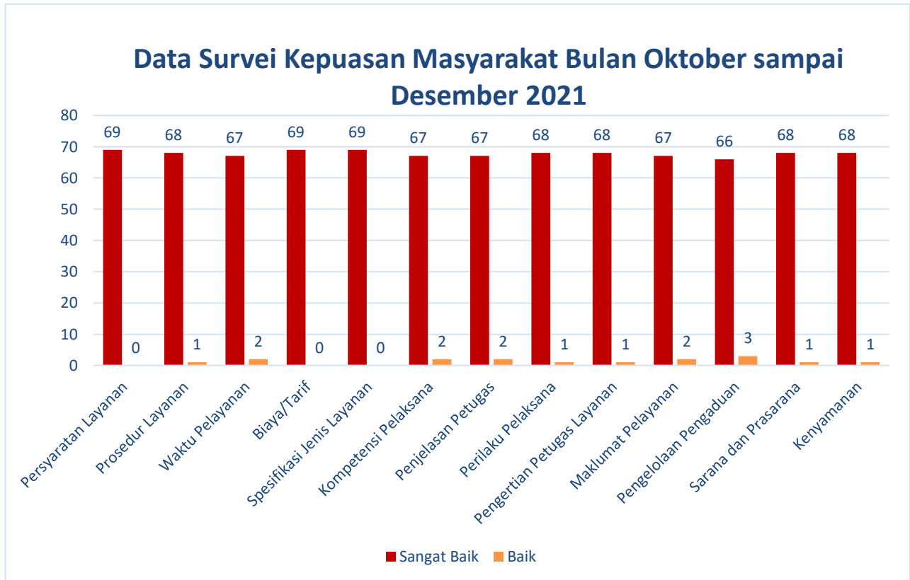
Grafik 1. Grafik Data Survei Kepuasan Masyarakat Bulan Oktober s.d Desember 2021

Responden SKM merupakan pengunjung yang menerima layanan dari ULT LPMP Provinsi Sumatera Utara. Dari hasil Survei Kepuasan Masyarakat secara keseluruhan yang terlaksana pada Bulan Oktober sampai Desember Tahun 2021 dapat disajikan pada grafik berikut ini :