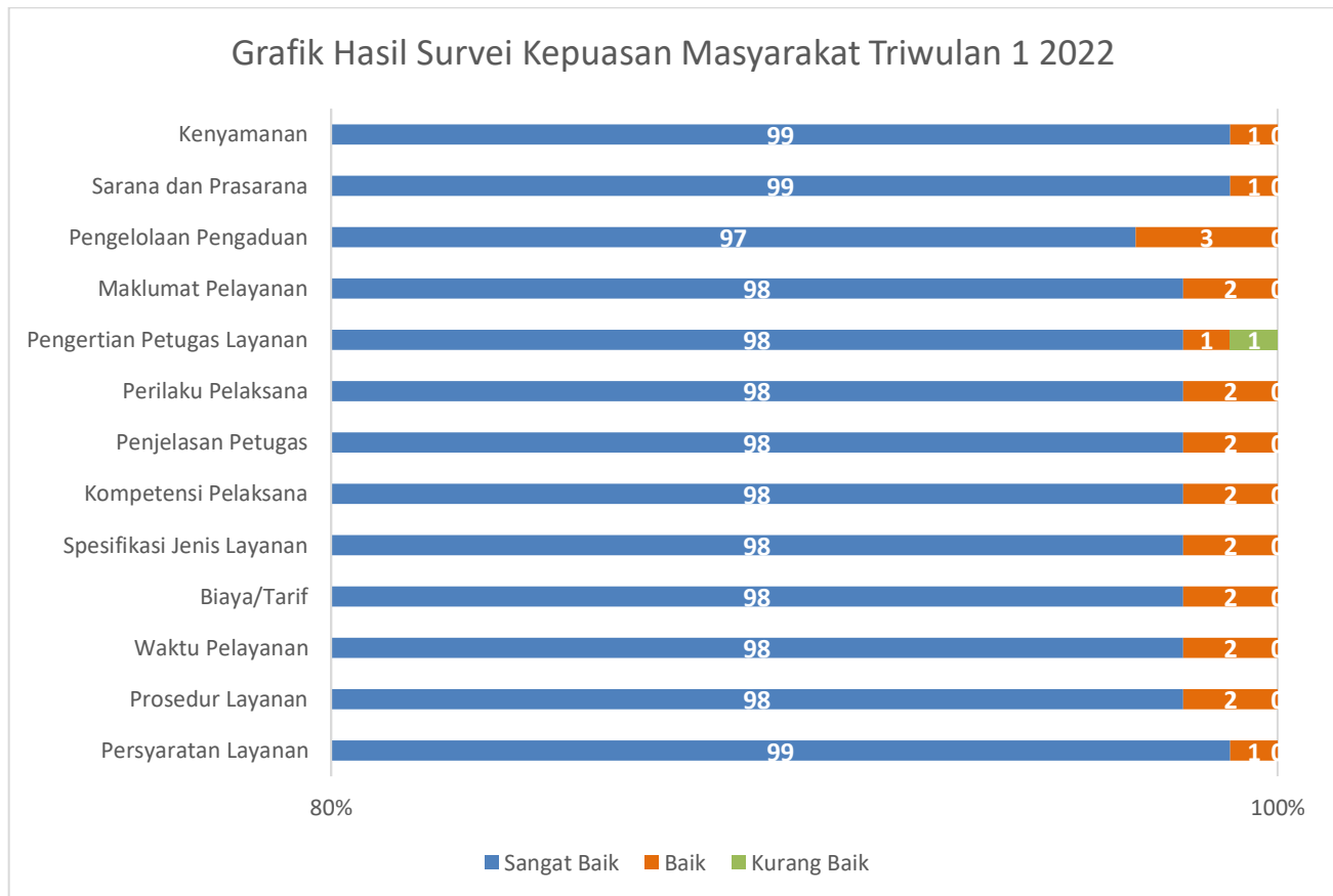
Grafik 2. Grafik Hasil Survei Kepuasan Masyarakat Triwulan 1 Tahun 2022 Secara Keseluruhan

Dari grafik diatas dapat dilihat secara umum layanan di Unit Layanan Terpadu LPMP Provinsi Sumatera Utara sudah sangat baik. Perlu dilakukan perbaikan pada unsur pengelolaan pengaduan, pelaksanaan maklumat pelayanan, perilaku petugas, penjelasan petugas dan kompetensi pelaksana. Dari hasil ini perlu dilakukan pelatihan untuk meningkatkan kompetensi petugas pelaksana agar layanan yang diberikan kepada pelanggan semakin meningkat.